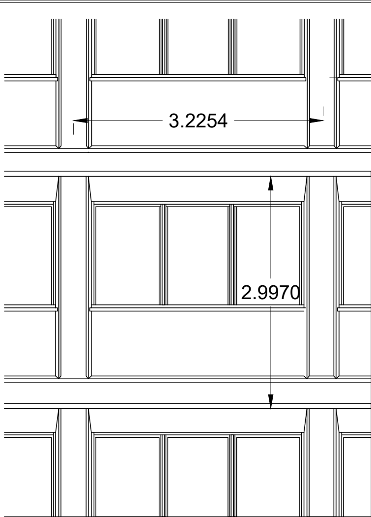
Parte da elevação escala

nucleo oco pre-fabricado de blocos de terra cota com pedra artificial polida